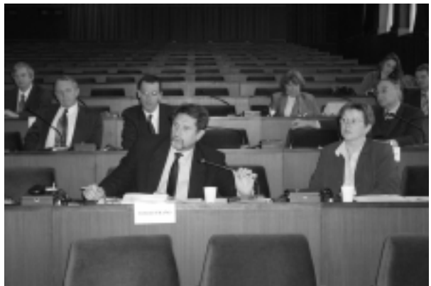
Pohľad do sály počas rokovania mestského zastupiteľstva.

Na rokovaní boli predložené pripomienky k Návrhu územného plánu Centrálnej mestskej zóny, ktorý spracovala komisia mestského zastupiteľstva v spolupráci s oddelením urbanizmu a architektúry odboru strategických činností. Do materiálu v rámci stavebného zákona zapracovali všetky pripo-