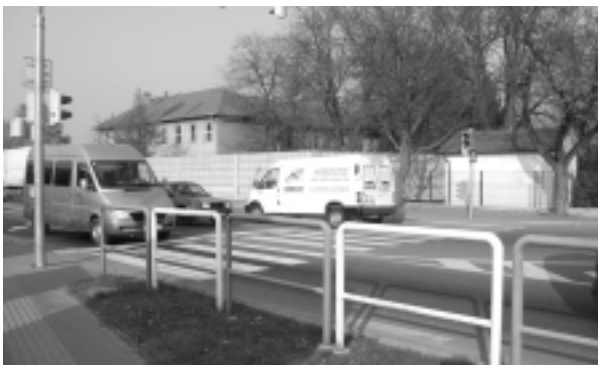
Svetelná križovatka v D. Krškanoch pomohla zvýšiť bezpečnosť cestnej premávky.

A tak už od 5. októbra každú stredu v mesiaci v čase od 16. do 18. hodiny sa môžu obyvatelia obracať so svojimi sťažnosťami a podnetmi na príslušníkov mestskej polície v zasedačke Kultúrneho domu v Dolných Krškanoch. V tomto čase sa môžu taktiež bližšie oboznámiť so základnou činnosťou mestskej polície.