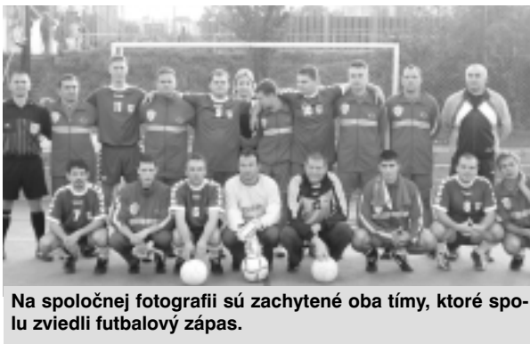
Na spoločnej fotografii sú zachytené oba tímy, ktoré spolu zvedli futbalový zápas.