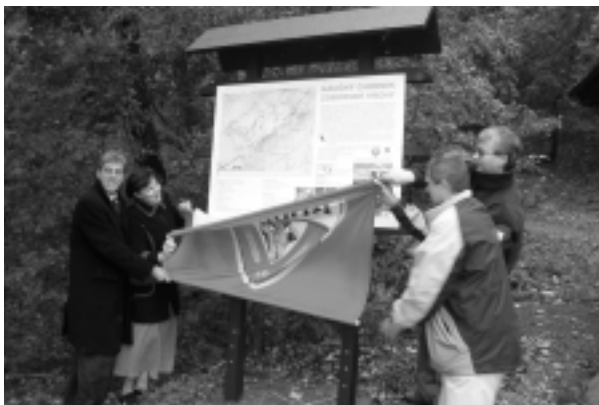
Obnovený náučný chodník na Zobor slávnostne otvorili 21. októbra.

Značka Corgoň v spolupráci s Nitrianskou komunitnou nadáciou, mestom Nitra a spoločnosťou Tesco rozbehla v období od 29. novembra 2004 do 31. marca 2005 projekt na s názvom Na Nitru! Boli to práve obyvatelia Nitry, ktorí mali možnosť hlasovať a rozhodnúť, ktorý z troch predložených projektov najvýraznejšie prispeje ku skvalitneniu životných podmienok ich mesta. Pred ôsmimi mesiacmi občania svojimi hlasmi podporili obnovu náučno-turistického chodníka Zobor v Nitrianskom lesnom parku, ktorý je do značnej miery zafažovaný návštevnosťou a ľudskými aktivitami. Tento víťazný projekt z kategórie TURISTI získal 3 911 z celkového počtu 5 567 hlasov (212 bolo neplatných). Získal sumu 305 456 Sk, z čoho 150 000