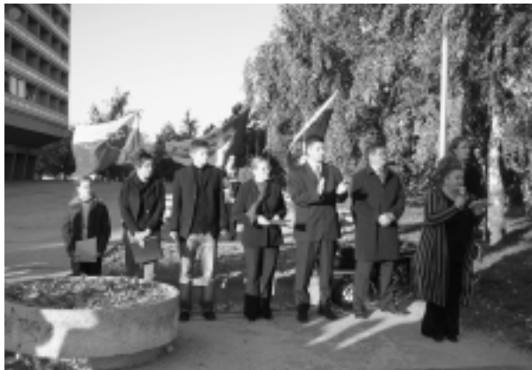
Účastníci osláv 190. výročia narodenia Ľudovíta Štúra.